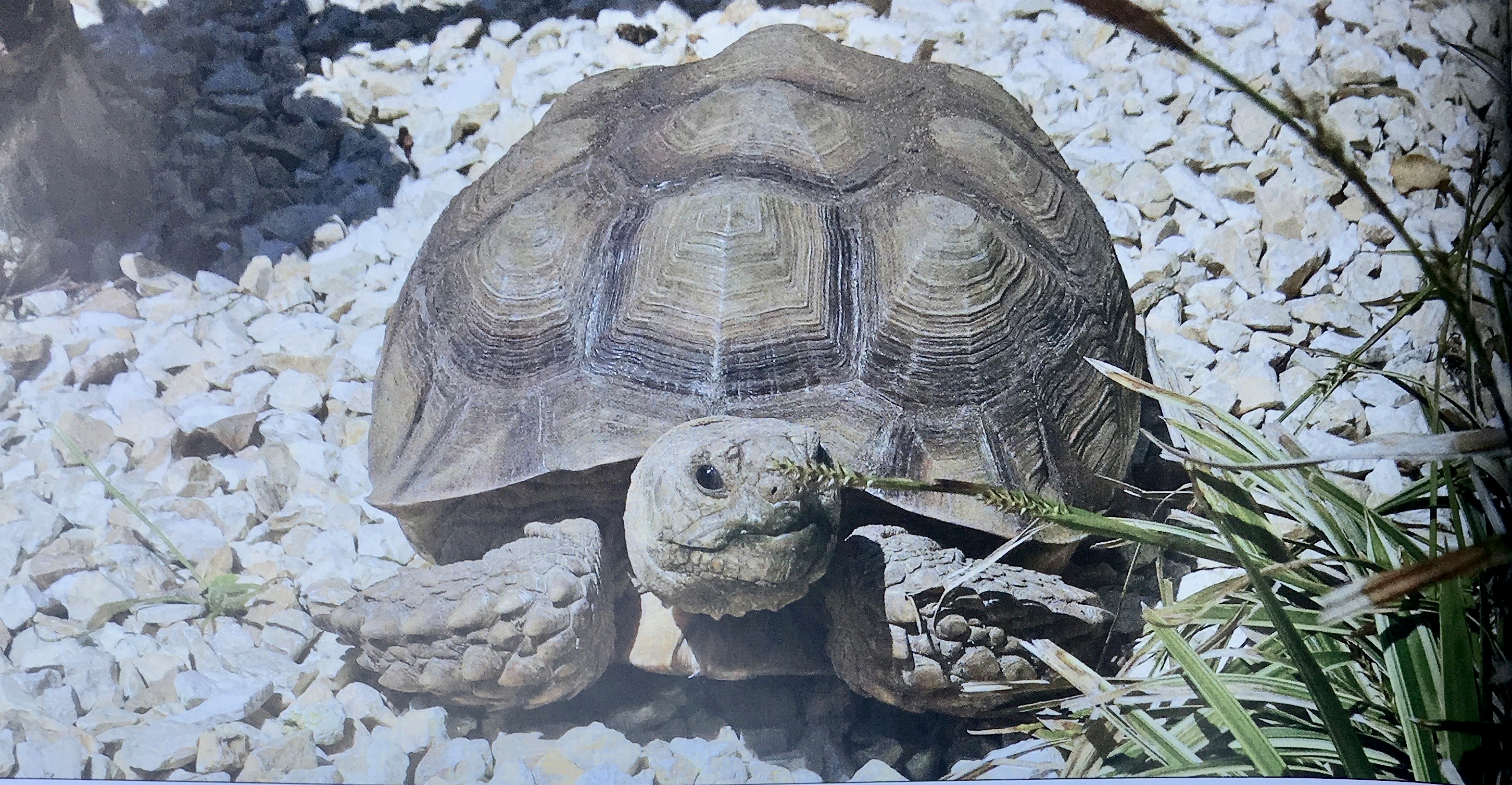
Den Schildkröten steht unterschiedlichstes Substrat zur Verfügung

Baden benutzt werden. Das konnten wir mehrfach selbst beobachten!